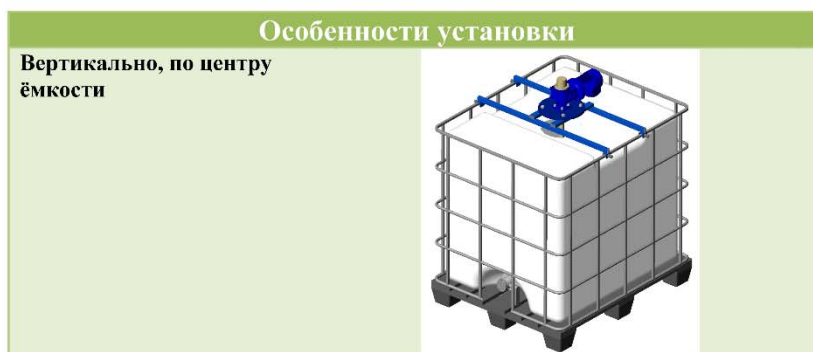
Габаритные размеры емкости "Еврокуб" с установленной мешалкой

*в зависимости от состава жидкости, в пределах таблицы хим. совместимости