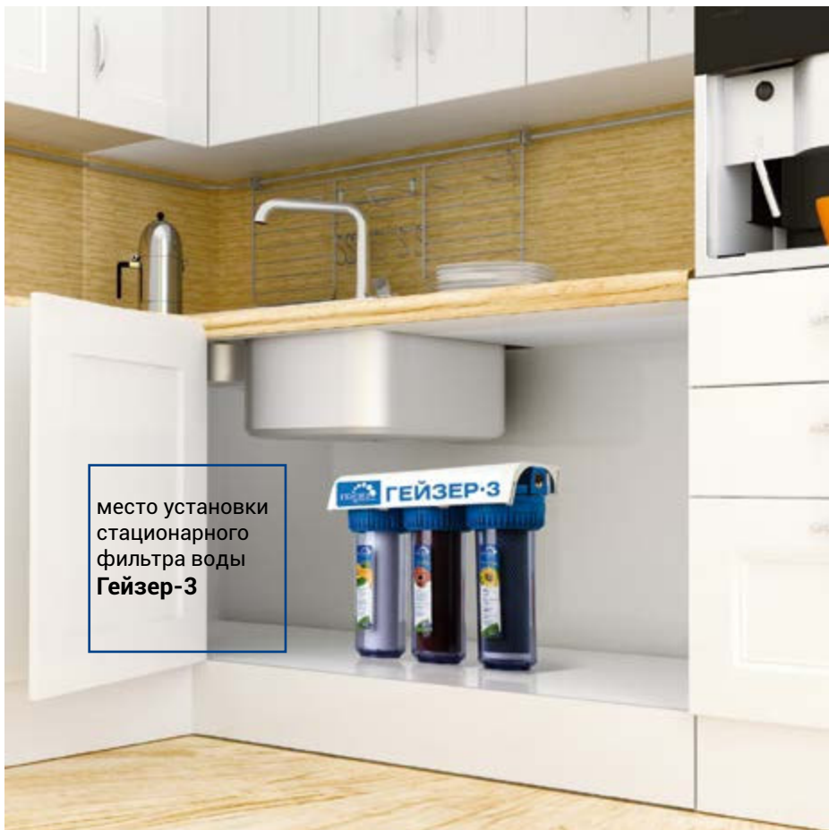
место установки стационарного фильтра воды Гейзер-3