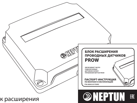
Блок расширения проводных датчиков ProW